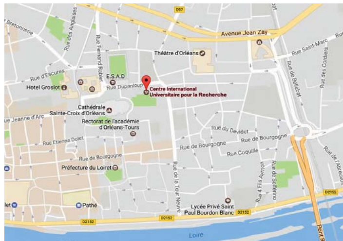
Hôtel Dupanloup | Centre International Universitaire pour la recherche

Le projet CorMéCoULi entend faire connaître et valoriser un patrimoine régional méconnu : les comptabilités médiévales des villes ligériennes (Orléans, Tours, Amboise) conservées en Région Centre-Val de Loire, pour les années 1350-1500. Ces pièces exceptionnelles, suscitées par la volonté des rois et des princes de la maison des Valois de contrôler l'activité financière des communautés auxquelles ils avaient accordé leur confiance, constituent un outil remarquable d'analyse de la genèse de l'État moderne en Europe. Elles révèlent aussi l'identité culturelle, ancienne et partagée, de ces villes intégrées à différents apanages (Touraine, Orléanais). Le projet vise à numériser ces pièces comptables, les analyser et produire une base de données destinée à faciliter leur consultation, grâce au travail collectif des équipes d'archivistes municipaux et des laboratoires rattachés aux deux universités régionales. Ce projet a vocation à participer au consortium COSME, dédié aux approches numériques multiples des "Sources médiévales", rattaché au TGIR Huma-Num du CNRS, et à donner à ces comptabilités régionales une visibilité internationale.